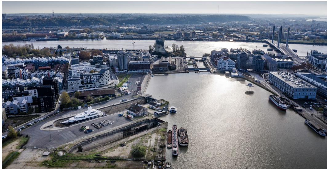
Bassins à flot

Les Bassins à flot renouent avec le transport fluvial de marchandises à travers un voyage test entre Damazan et Bordeaux